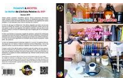
Couverture du premier livre revu et augmenté par David Damour

Ainsi il demande sur son site internet 15 à ses futurs lecteurs, de précommander son premier livre afin de l'imprimer : le livre est imprimé aux imprimeries Sepec en Novembre 2016.