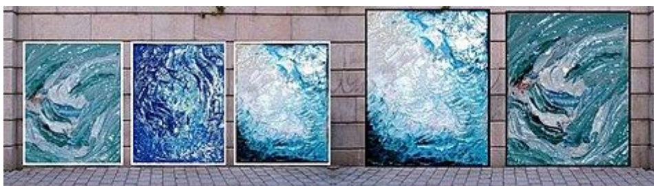
"C'est Vagues" Peinture à l'huile sur toile par David Damour

David Damour dit avoir voulu passé beaucoup de temps à apprendre toute ces connaissances connexes afin d'être le plus autonome et libre possible pour mener à bien des projets de A à Z sans aide extérieure, afin d'écrire et de publier des livres didactiques sur les couleurs du peintre et toutes les techniques picturales du XXI e : il a sacrifié une carrière artistique toute tracée, pour mener à bien ses projets de partage de connaissances, car tout n'a pas été évoqué dans des livres au sujet des techniques picturales et des pigments et colorants du peintre du XXI e .