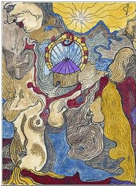
Mystic Circus Colorants et pigments sur papier par David Damour