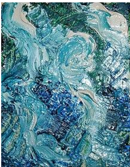
C'est Vagues par David Damour Peinture à l'huile sur toile