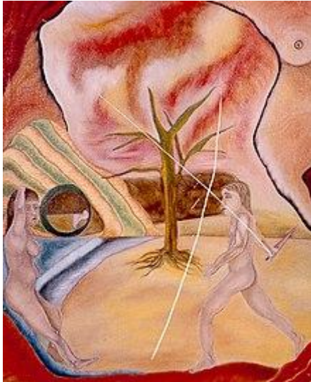
La femme adultère peinture à l'huile sur toile par David Damour

Certaines de ses œuvres sont parfois comparé à Balthus : surtout les plus classiques et figuratives.