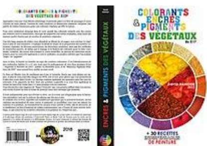
Couverture Colorants encres et pigments des végétaux Livre 3 par David damour

· En Avril 2018 il débute l'écriture de son troisième livre de 425 pages, "Colorants Encres et Pigments des Végétaux du XXIe" qu'il publie en novembre 2018 à la BNF et qu'il fait imprimer aux imprimeries Sepec : ce troisième ouvrage est un franc succès aussitôt auprès des lecteurs 19 et en 2020, auprès de la communauté scientifique 20