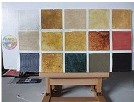
Palette de 14 végétaux résistants 1 mois au soleil, par David Damour

En 2020 il réalise un grand test de résistance à la lumière et au soleil de tous les pigments végétaux et animaux qu'il a créés ainsi que de certains pigments inorganiques du début du XXI e : les résultats de ses recherches seront compulsés dans son livre N°4.