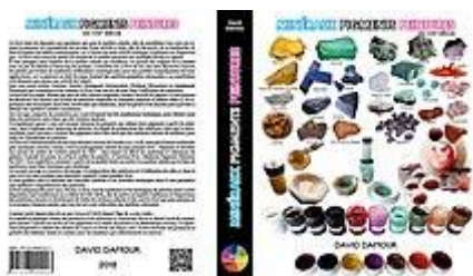
Couverture du livre 2 Minéraux Pigments Peintures David Damour

· En Mai 2017 il commence l'écriture d'un second livre de 640 pages "Minéraux Pigments Peinture du XXIe" qu'il publie à la BNF et qu'il fait imprimer aux imprimeries Sepec en mars 2018 https://www.amazon.fr/dp/B07D2XCNOG?ref=myi_title_dp 18