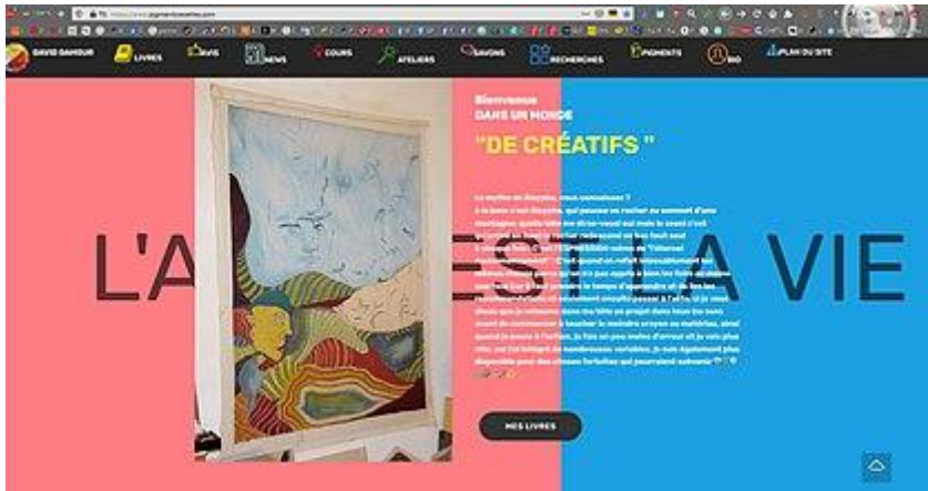
Site internet PigmentsRecettes par David Damour